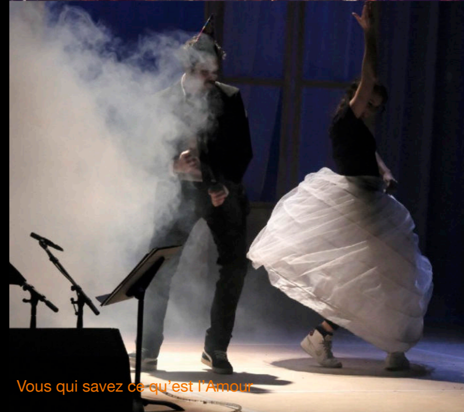
Vous qui savez ce qu'est l'Amour