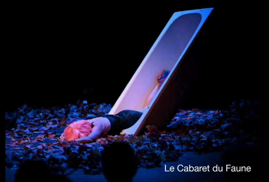
Le Cabaret du Faune